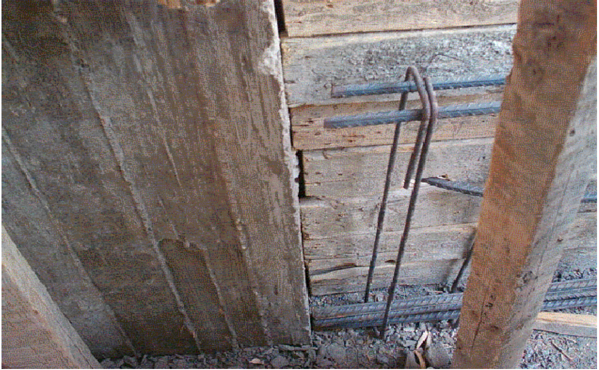
عدم تنفيذ الوصل بين حديد تسليح الكمرات المقلوبة والأعمدة