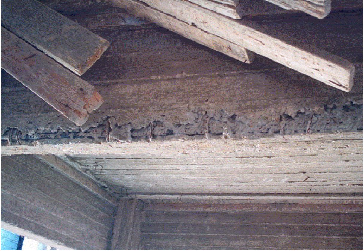
* سوء توزيع ورص حديد التسليح - سوء اعمال النجارة والتقويات - عدم دمك الخرسانة