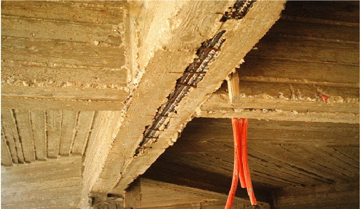
* سوء توزيع ورص حديد التسليح - عدم دمك الخرسانة