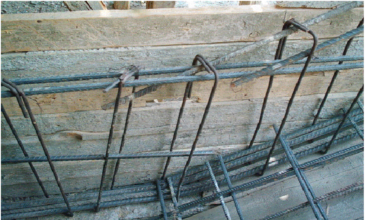
* عدم تنفيذ طول الرباط الكافى بين الاسياخ