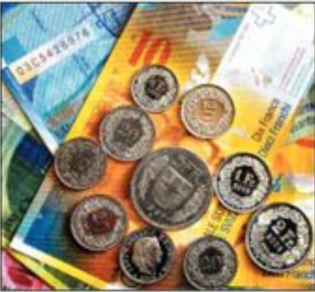
Hari Widowati, Bloomberg

Seperti diketahui, beberapa waktu lalu bank sentral Swiss terpaksa membeli valas, termasuk euro dan dollar AS untuk mencegah deflasi dan mendorong ekspor Swiss. Setelah cadangan devisanya naik empat kali lipat, SNB memberikan isyarat bahwa ia akan berhenti membeli valas. Sebab, kepemilikan valas yang terlalu besar juga bisa meningkatkan risiko valas yang harus dihadapi bank sentral Swiss.