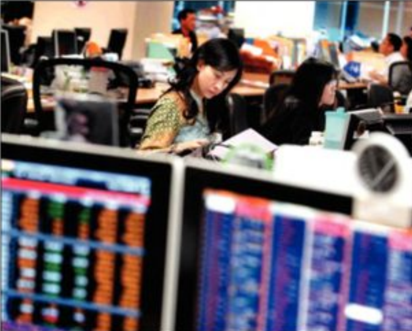
Kuartal III dan IV adalah waktu yang tepat bagi korporat untuk menerbitkan obligasi.

laju inflasi bulanan diprediksi tetap tinggi pada Agustus ini. Saat ini, Bank Indonesia (BI) masih mempertahankan BI rate di posisi 6,5%. Sekedar mengingatkan, inflasi Juli sebesar 1,57% adalah yang tertinggi sepanjang 2010. Angka ini lebih besar daripada ekspektasi analis yang mematok di kisaran 1,1%. Hingga pertengahan 2010, jumlah penerbitan obligasi korporasi telah mencapai Rp 21,19 triliun. Sejumlah institusi sudah mengumumkan niatnya untuk merilis obligasi di semester II ini. Salah satunya, PT Adira Dinamika Multi Finance Tbk (ADMF). Mereka akan menerbitkan obligasi senilai Rp 2 triliun Oktober mendatang.