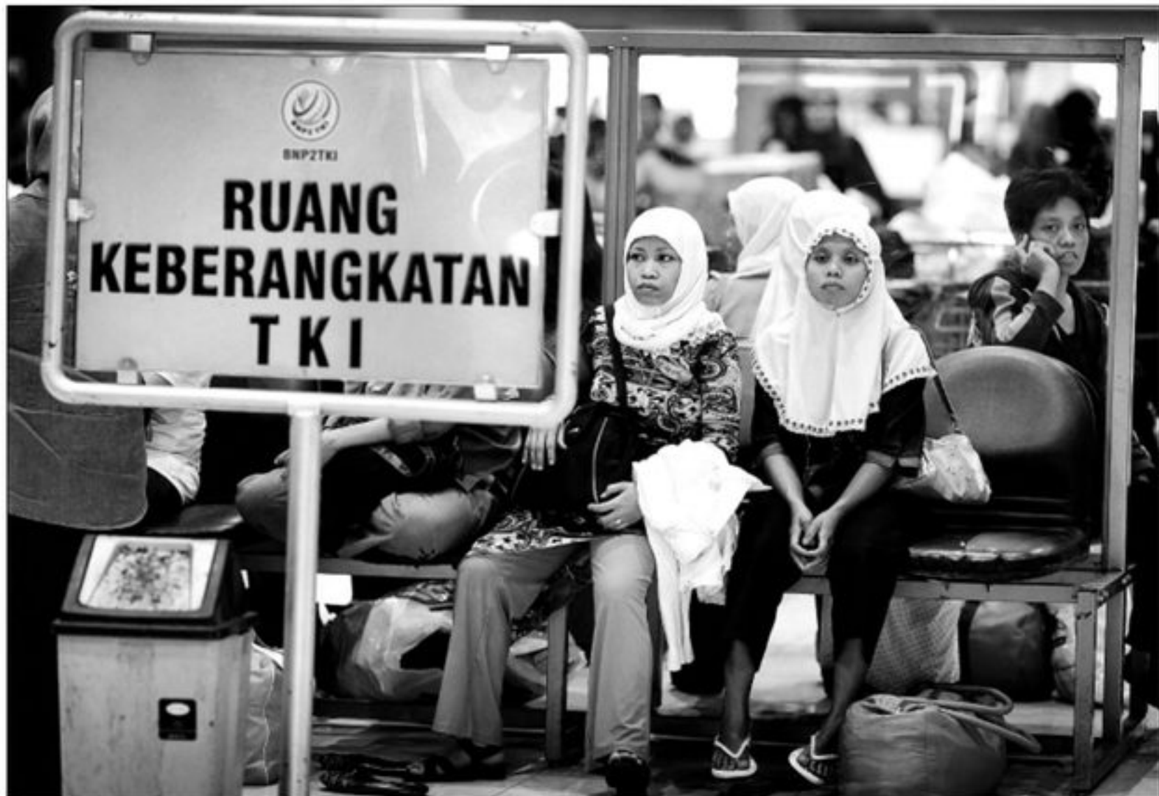
Tenaga kerja Indonesia (TKI) menunggu di Terminal TKI Bandara Soekarno-Hatta, Banten, beberapa waktu lalu. Pemerintah Indonesia tetap akan mengajukan standar gaji minimal untuk TKI, walaupun Malaysia tidak mengenal konsep gaji minimum untuk pembantu rumah tangga.