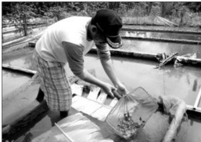
KONTAN/Wahyu Tri Rahmawati

Asal tahu saja, para pembudidaya lele di Desa Duren Mekar tidak terikat dengan satu pembeli. "Siapa yang datang duluan, dia yang