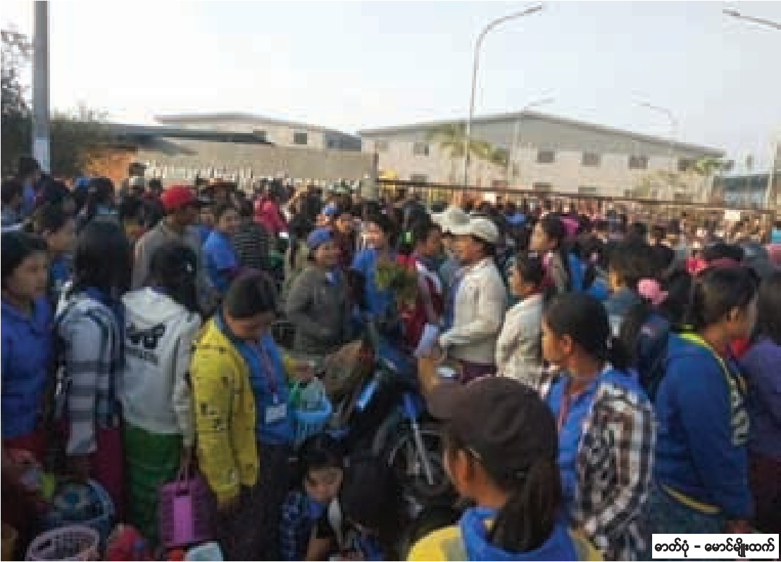
ဇန်နဝါရီလ ၁၄ ရက်နေ့ နံနက်ပိုင်းက ယင်းစက်ရုံ သပိတ်မှောက်လုပ်သားများ အလုပ်ခွင်သို့ပြန်လည်ဝင်ရောက်နေစဉ်။

အလုပ်ရှင်၊ အလုပ်သမား အကျိုး စီးပွားဆိုင်ရာ တောင်းဆိုချက် ၈ ချက်ကို ဇန်နဝါရီ ၁၂ ရက်နေ့ကတည်းက နှစ်ဖက် ဖြေလျှော့ပြီး သဘောတူညီမှုရခဲ့ကြောင်း ဇန်နဝါရီ ၁၃ တွင် ကတိကဝတ်စာချုပ်လက်မှတ် ရေးထိုးရန်ဖြစ်သော်လည်း အလုပ်ရှင်ဘက် က သဘောတူထားမှုတွင် မပါဝင်သည့်