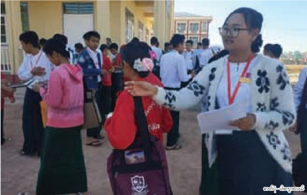
ခေတ်ပို-ပါကွေးလယ်

ပညာရေးဝန်ကြီးဌာနက အခြေခံပညာကျောင်း အတန်းငယ်များ၏ စာမေးပွဲကို မတ်လနှောင်းပိုင်းတွင် ကျင်းပရန်စီစဉ်မှုကို ကန့်ကွက်သည့်အနေနှင့် ယနေ့နံနက် ၈ နာရီခန့်က လွိုင်ကော်ပညာရေးကောလိပ်တွင် ဖြိုကြဲစိမ်းလုပ်ရှားမှုကို စတင်ခဲ့သည်။ အဆိုပါ ဖြိုကြဲစိမ်းလုပ်ရှားမှုကို တိုင်းနှင့်ပြည်နယ်အသီးသီးတွင် ဇန်နဝါရီလ ၇ ရက်နေ့ကစတင်ပြီး စစ်ကိုင်းပညာရေးတက္ကသိုလ်က စတင်ပြုလုပ်ခဲ့ပြီး အခြားကောလိပ် နှင့် တက္ကသိုလ်များက ဆက်တိုက်ပြုလုပ်လာကြခြင်းဖြစ်သည်။